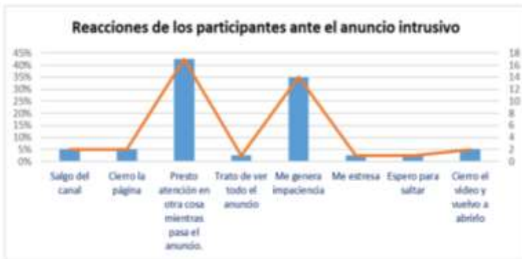
Figura 2. Acciones y reacciones de los participantes ante los anuncios en YouTube.

Teniendo en cuenta el resultado de la encuesta se puede decir que la acción intrusiva de la publicidad no genera un impacto deseado y, lejos de provocar el efecto del modelo AIDA (Atención, Interés, Deseo y Acción), lo que se logra en mayor medida es la irritación o molestia en el proceso de búsqueda de información, y así respondió el 95% de los estudiantes que formaron partes de este estudio.