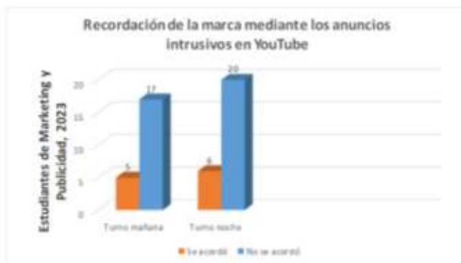
Figura 1. Resultado de la recordación de la marca por parte de los estudiantes participantes.

Los resultados obtenidos acerca de la recordación de la marca mediante el empleo de la publicidad intrusiva han demostrado que, de un total de 48 participantes el 77% no se acordó qué marca aparecía en el anuncio antes del video tutorial, lo cual indica que solo el 23% sí pudo acordarse luego de un esfuerzo mental. Esto demuestra que la mayoría de los anuncios pasan desapercibidos ante los ojos del público online como se muestra en el gráfico siguiente.